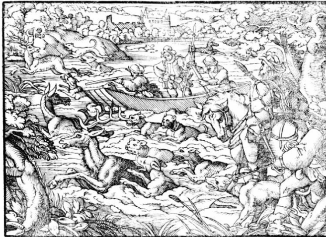
Ein Hirsch in einem Wasser.

Lindner 11.0059.03 (ohne Hinweis auf die Unvollständigkeit); Knorring S 16